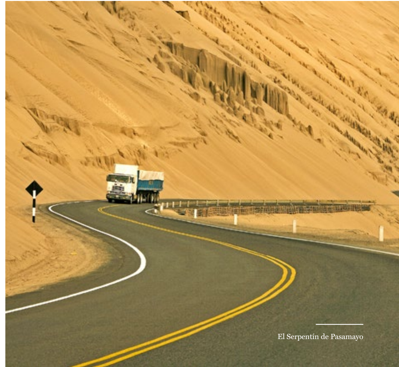
El Serpentin de Pasamayo

Nuestra principal prioridad es salvaguardar la vida humana. Seguiremos trabajando intensamente para concientizar a conductores y peatones en el respeto de las normas de tránsito, con el fin de impactar en la reducción de accidentes.