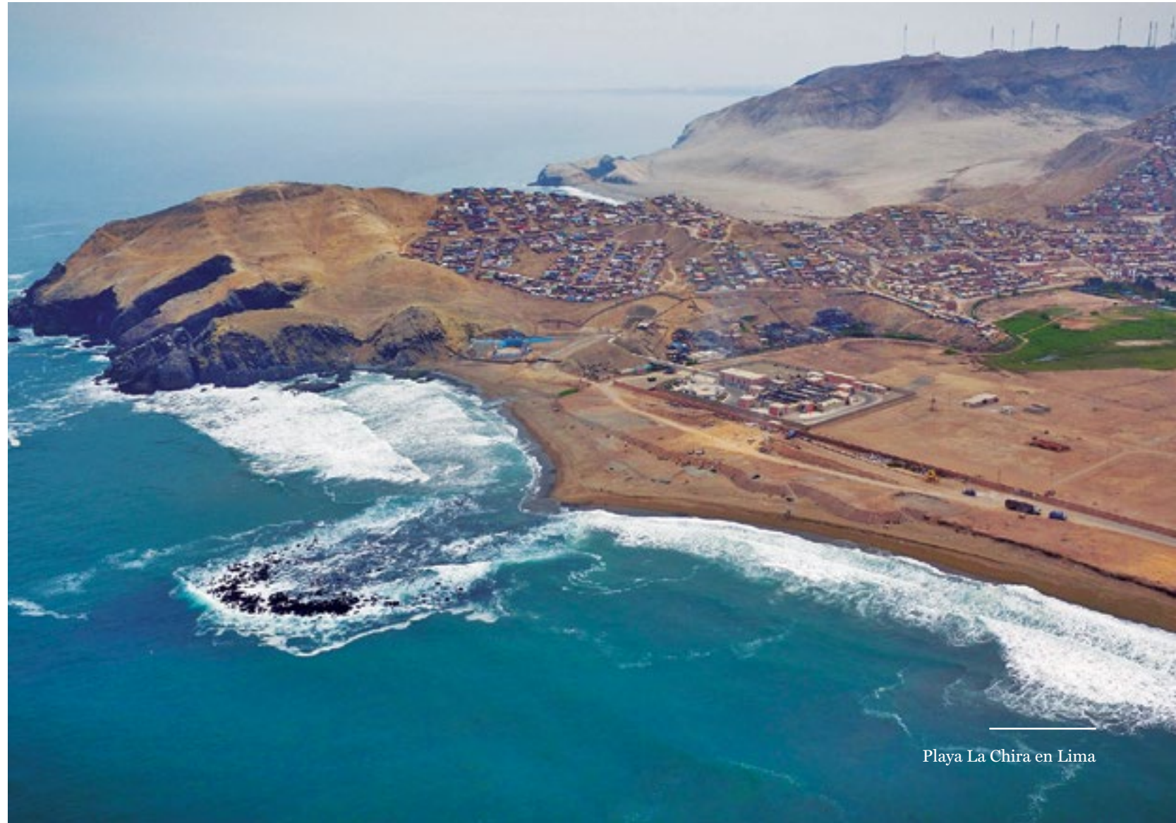
Playa La Chira en Lima

La Chira trata al mes alrededor de 15 millones de m 3 de agua, lo que representa más del 25% de las aguas residuales de Lima. Su funcionamiento ha permitido proteger el medio ambiente, especialmente de las playas ubicadas entre la quebrada de Armendáriz (Miraflores) y Conchán (Villa El Salvador). De esta forma, aportamos a la seguridad y la calidad de vida de más de 9 millones de limeños.