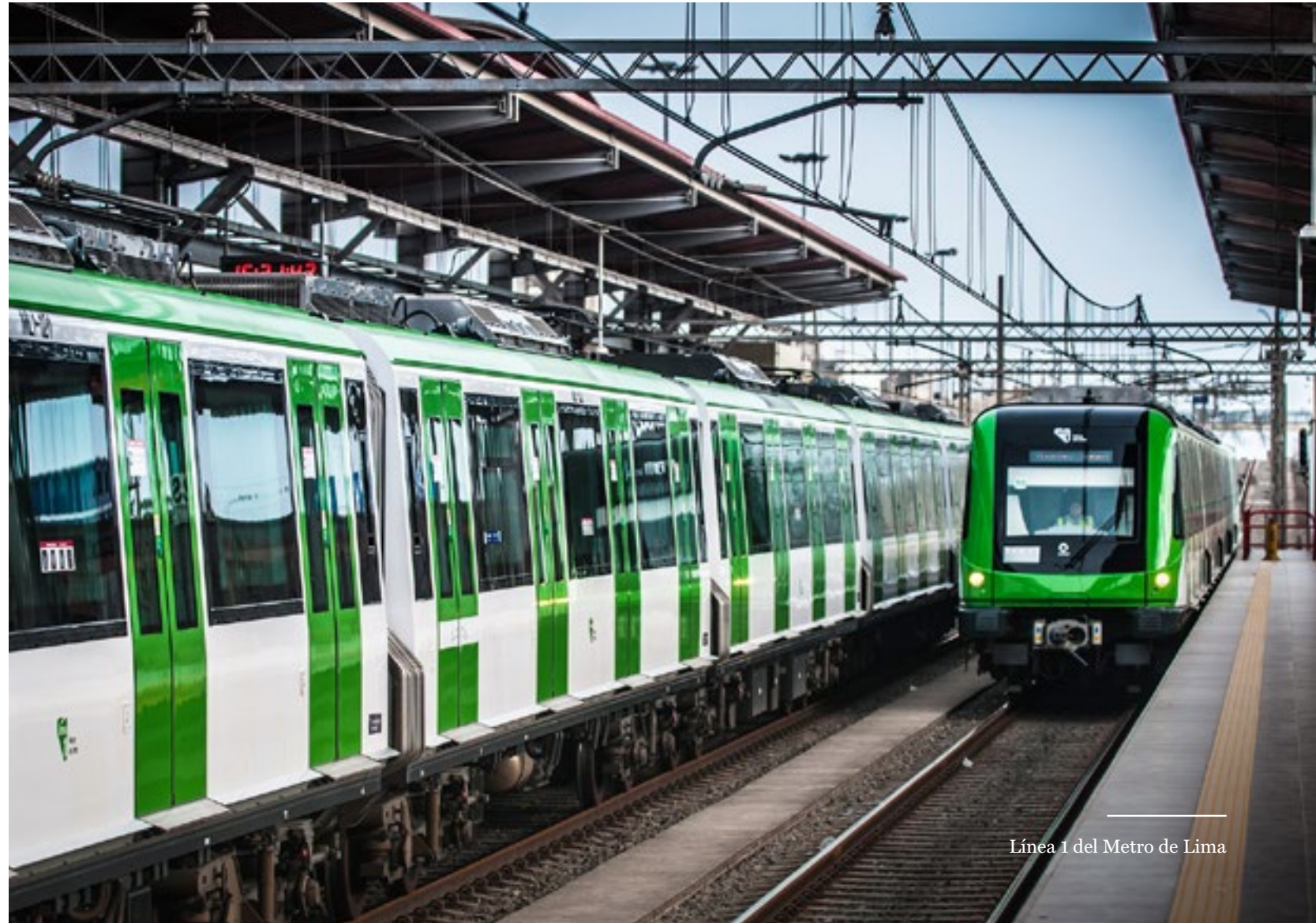
Línea 1 del Metro de Lima

Asimismo, en este año logramos consolidarnos como agentes de cambio social, gracias a nuestro enfoque “blindaje social mutuo”, una interpretación del concepto de “valor compartido” que busca generar confianza en nuestros clientes y la comunidad. Sobre la base de este enfoque desarrollamos el Modelo de Infraestructura Sostenible, que simboliza nuestro accionar como empresa. Este modelo consiste en promover el diálogo y la comunicación transparente, de forma que podamos forjar un vínculo sólido con nuestros grupos de interés que nos permita lograr su apoyo y reconocimiento, a la vez que fomente el cuidado recíproco.