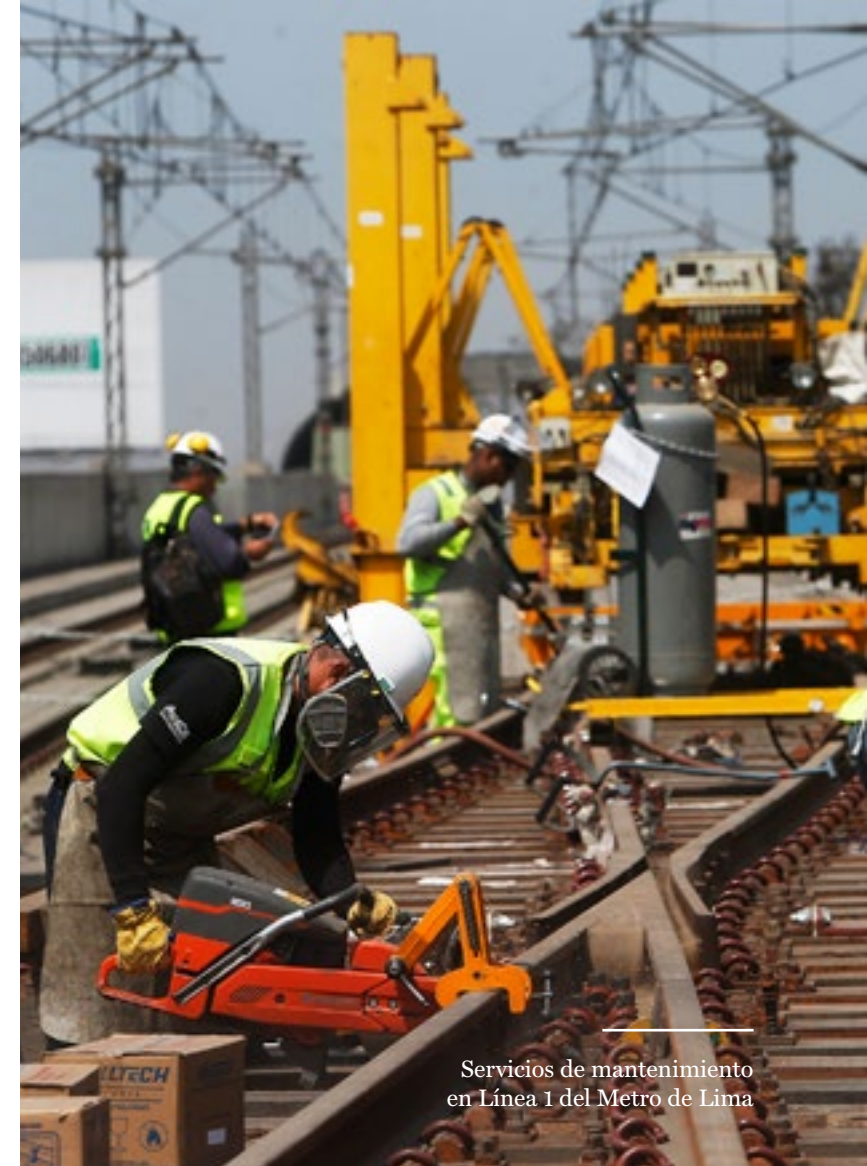
Servicios de mantenimiento en Línea 1 del Metro de Lima

Promociona actividades artísticas y culturales