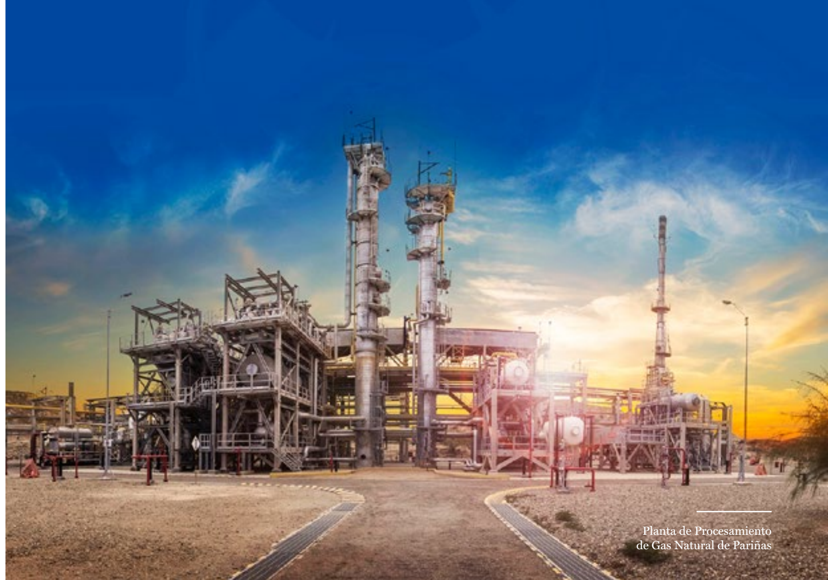
Planta de Procesamiento de Gas Natural de Pariñas

En cuanto al negocio de gas natural, nuestra planta Pariñas procesó un promedio de 30.1 millones de pies cúbicos diarios de gas natural asociado y produjo un promedio de 1,084 barriles de líquidos de gas natural diarios, principalmente de GLP.