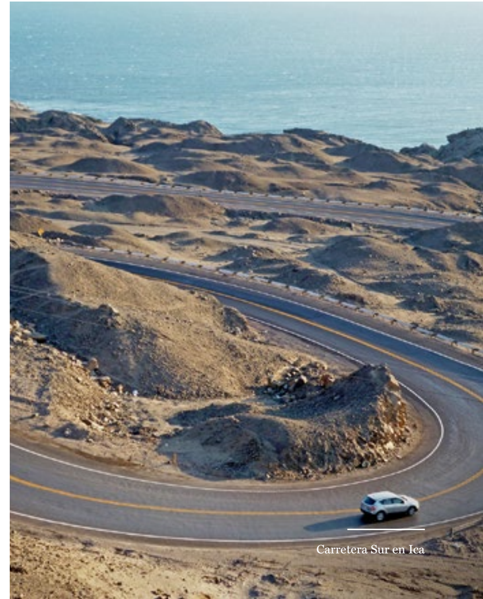
Carretera Sur en Ica

TRABAJOS DE US$16 MILLONES en trabajos para la concesión Survial