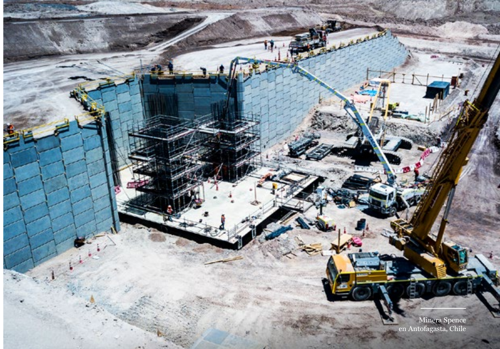
Minera Spence en Antofagasta, Chile

En la industria de hidrocarburos, nos adjudicamos el mantenimiento de equipos estáticos en paro de planta en la unidad de cracking catalítico de la refinería de Aconcagua, en la región de Valparaíso, Chile. El monto del contrato con la