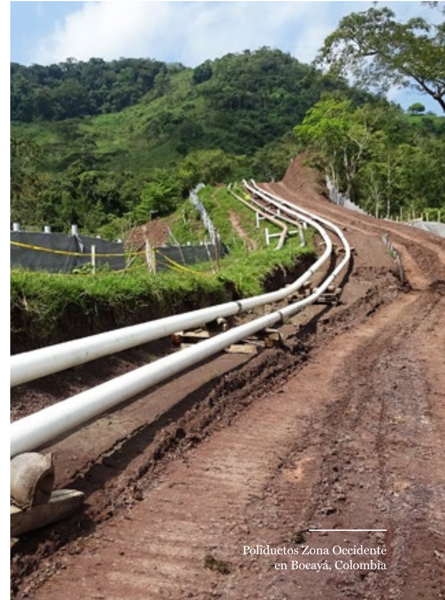
Poliductos Zona Occidente en Bocayá, Colombia

En suma, durante el 2018 Morelco logró consolidar el valor diferencial que nos caracteriza: la ejecución de obras con diligencia y aplicando el máximo conocimiento técnico en zonas geográficas desafiantes, incluso en ocasiones en que se presentan situaciones socialmente delicadas.