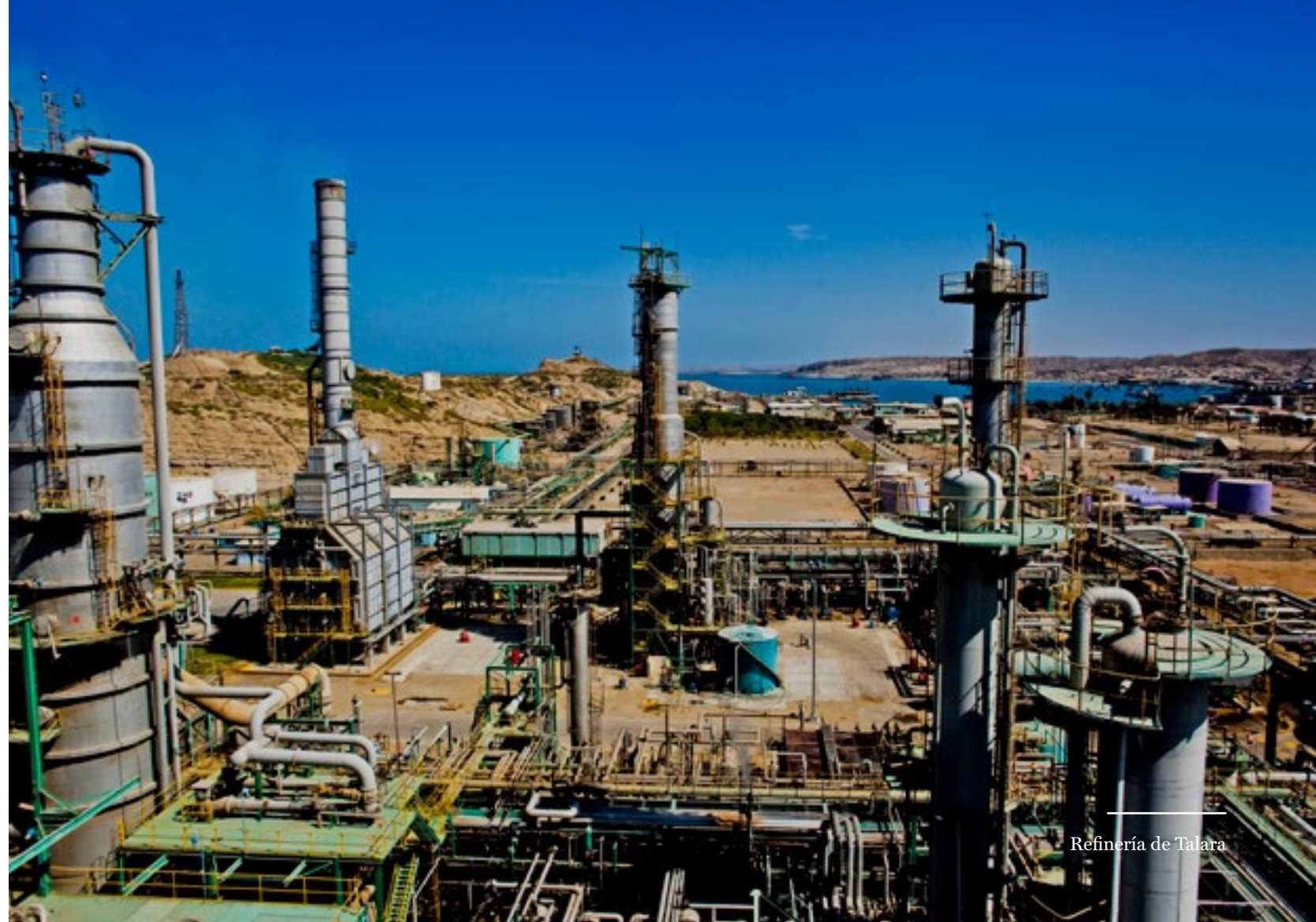
Refinería de Talara

Todo este trabajo se alinea con nuestra estrategia de posicionarnos como una empresa de comprobada experiencia y reconocida trayectoria en el desarrollo de ingeniería y supervisión de obras; así como una organización capaz de liderar y gestionar la ejecución de proyectos EPC en toda la región.