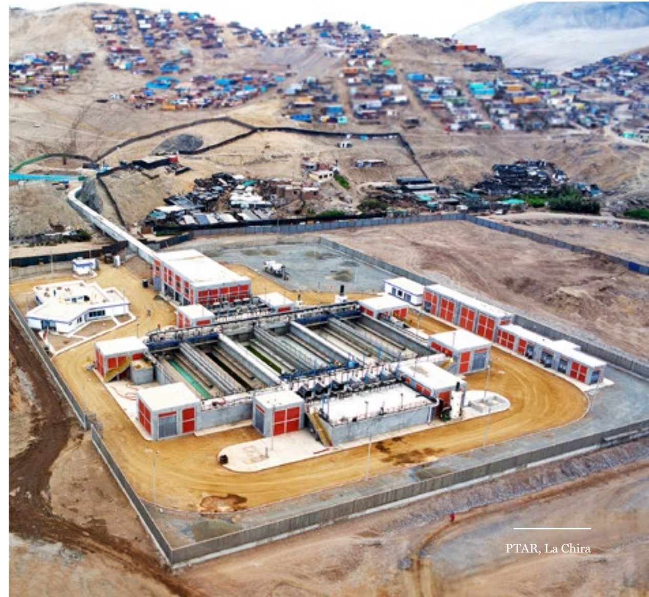
PTAR, La Chira

Cada uno de los trabajos que llevamos a cabo durante el 2018 fortaleció nuestras capacidades como líderes en permisología y elaboración de instrumentos de gestión ambiental para la industria minera, de hidrocarburos, de transporte y otros rubros.