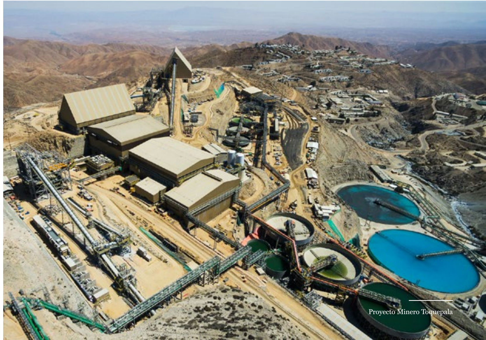
Proyecto Minero Toquepala

Finalmente, desarrollamos el proyecto de ampliación de la mina Toquepala, instalando un sistema completo de chancado, molienda, flotación y filtrado. Esta obra permitirá que nuestro cliente Southern Perú duplique su capacidad de procesar mineral de 60,000 a 120,000 TMPD.